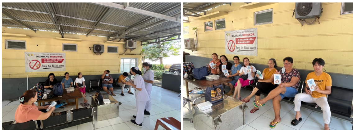
Gambar 3. Penyampaian Penyuluhan Tentang Kesehatan Mental Keluarga Pasien Hemodialisis

Kegiatan edukasi kesehatan dilaksanakan di ruang tunggu Ruang Hemodialisis Melati Rumah Sakit Prof. Dr. R. D. Kandou Manado pada tanggal 9 Desember 2024 pukul 10.00 WITA. Kegiatan penyuluhan kesehatan mental kepada keluarga pasien hemodialisis berlangsung secara efektif, ditandai dengan keterlibatan aktif peserta selama sesi. Penyuluhan ini mengusung pendekatan edukatif yang menitikberatkan pada pengenalan terhadap stres, baik dari sisi sumber, gejala, dampak, maupun strategi penanganannya. Materi yang disampaikan mencakup sumber stres yang umum dialami keluarga pasien hemodialisis, tanda-tanda stres fisik dan emosional, serta strategi mengelola stres seperti membangun dukungan sosial, merawat diri, dan teknik relaksasi.