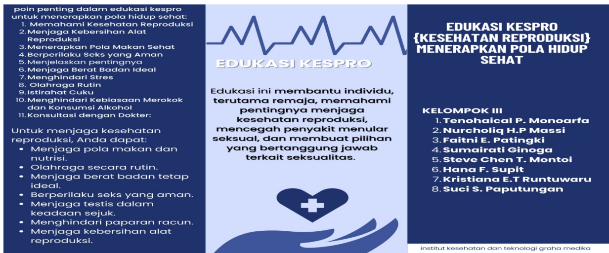
Gambar 2. Leaflet Edukasi Kesehatan Reproduksi