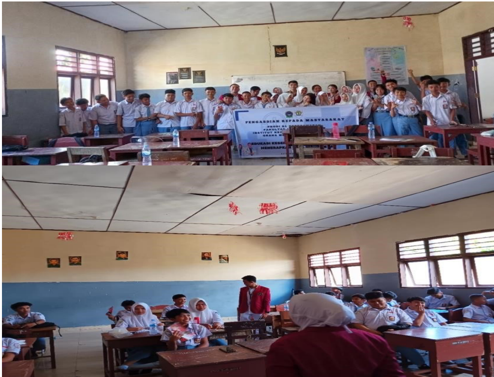
Gambar 3. Proses Pelaksanaan Penyuluhan Kesehatan Reproduksi

Tujuan edukasi kesehatan adalah tercapainya perubahan perilaku individu, keluarga dan masyarakat dalam membina dan memelihara perilaku hidup sehat dan lingkungan sehat, serta berperan aktif dalam upaya mewujudkan derajat kesehatan yang optimal, terbentuknya perilaku sehat pada individu, keluarga, kelompok dan masyarakat yang sesuai dengan konsep hidup sehat baik fisik, mental dan sosial sehingga dapat menurunkan angka kesakitan dan kematian, menurut WHO tujuan edukasi kesehatan adalah untuk merubah perilaku perseorangan dan masyarakat dalam bidang kesehatan (Tuhuteru et al., 2021).