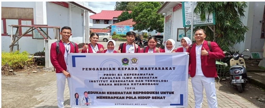
Gambar 4. Tim Pelaksana Penyuluhan Kesehatan Reproduksi