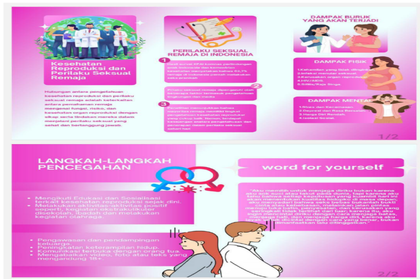
Gambar 2. Leaflet Edukasi Kesehatan Reproduksi Remaja