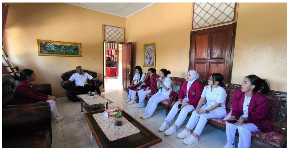
Gambar 3. Pertemuan dengan Pihak Sekolah untuk Koordinasi Pelaksanaan Kegiatan