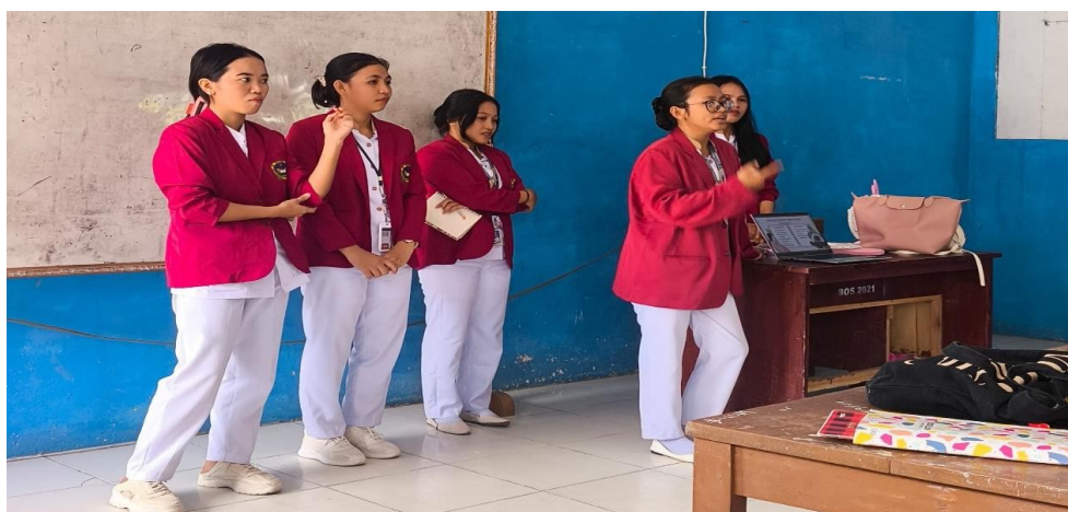
Gambar 4. Proses Penyuluhan Kesehatan Reproduksi Remaja