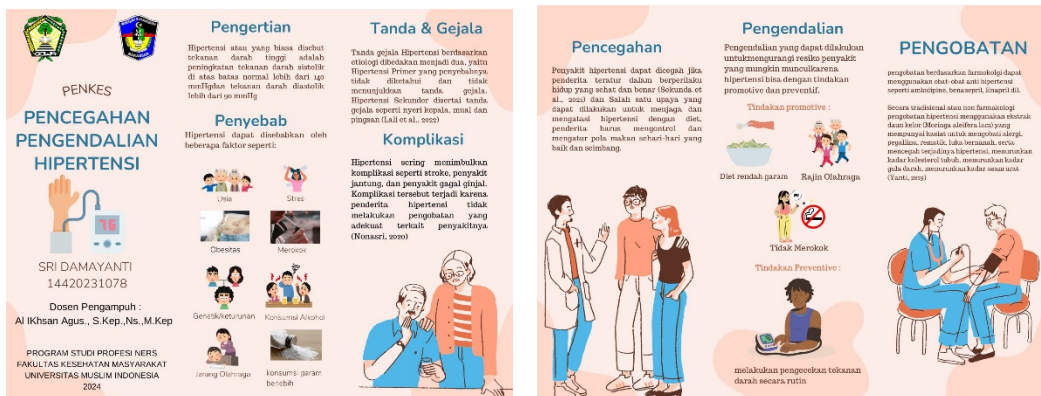
Gambar 2. Leaflet Penyuluhan Hipertensi