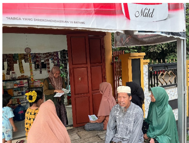
Gambar 3. Penyampaian Penyuluhan Kesehatan Tentang Pencegahan Hipertensi

Kegiatan penyuluhan kesehatan ini dilaksanakan kepada keluarga binaan di Desa Sokkolia dengan cara tatap muka langsung dengan metode ceramah mengenai pencegahan pengendalian hipertensi. Kegiatan ini berjalan dengan baik dan lancar yang dilaksanakan pada hari Minggu, 12 Mei 2024 pada pukul 10.00 s/d 10.15 WITA. Kegiatan ini dilaksanakan di rumah warga binaan yang dihadiri oleh warga binaan dan masyarakat sekitarnya.