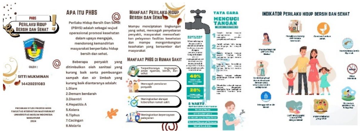
Gambar 1. Leaflet Penyuluhan PHBS