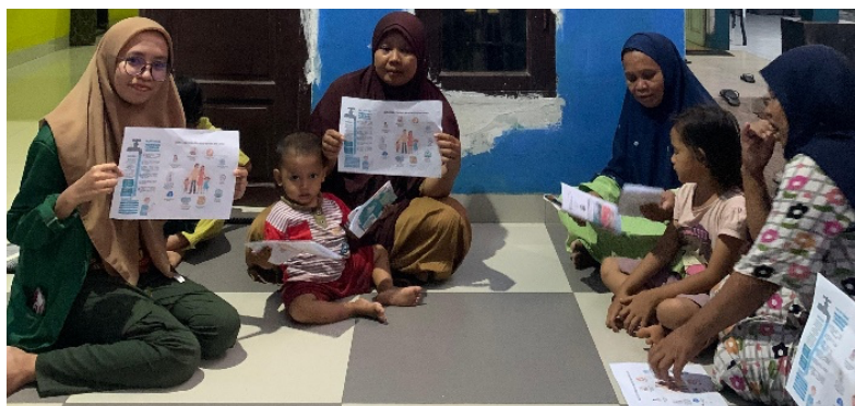
Gambar 3. Tanya Jawab Peserta Penyuluhan

Hasil dari kegiatan ini mencakup penyampaian tujuan penyuluhan, penyampaian materi dengan baik sesuai dengan perencanaan, dan kemampuan peserta dalam menguasai materi yang telah disampaikan. Penyuluhan ini bertujuan agar peserta memahami pentingnya PHBS. Keterlibatan seluruh anggota keluarga menciptakan suasana yang mendukung pembentukan pola PHBS. Anak-anak cenderung meniru perilaku orang dewasa daripada hanya mendengarkan perintah atau instruksi. Oleh karena itu, orang dewasa harus konsisten dan benar dalam mempraktikkan PHBS, baik di rumah maupun di luar rumah. Dengan demikian, anak-anak akan mengembangkan pola PHBS yang akan mereka praktikkan sepanjang hidup (Kemensos RI, 2020).