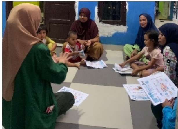
Gambar 2. Penyuluhan Kesehatan Tentang PHBS

Kegiatan ini dilaksanakan melalui tatap muka langsung, dengan menyajikan pendidikan kesehatan/ penyuluhan menggunakan metode ceramah mengenai Perilaku Hidup Bersih dan Sehat (PHBS). Kegiatan ini berjalan dengan lancar dan baik, dilaksanakan pada hari Minggu 12 Mei 2024 pukul 16.00 hingga 16.30 WITA. Pokok pembahasan yang disampaikan meliputi: 1) Penjelasan mengenai Perilaku Hidup Bersih dan Sehat: Materi mencakup pengertian dan pentingnya PHBS dalam menjaga kesehatan individu dan lingkungan; 2) Cara Mencuci tangan yang baik dan benar: penyuluhan memberikan informasi dan demonstrasi mengenai teknik mencuci tangan dengan benar, termasuk langkah-langkah yang tepat dan pentingnya kebersihan tangan dalam mencegah penularan penyakit.