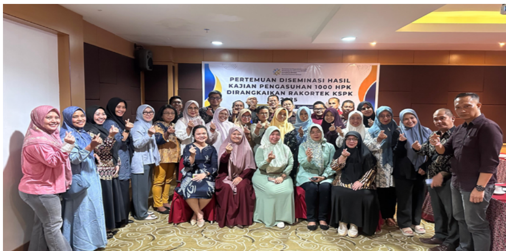
Gambar 3. Peserta, Panitia, dan Narasumber Kegiatan Diseminasi Policy Brief

Strategi ini terbukti efektif dalam menjangkau kelompok masyarakat yang lebih luas, terutama generasi muda dan calon orang tua. Hasil dari kegiatan ini menegaskan bahwa pendekatan yang melibatkan pemerintah, akademisi, dapat memperkuat advokasi kebijakan secara kolaboratif dan berkelanjutan di tingkat komunitas sebagaimana hasil evaluasi kegiatan pada peserta (Gambar 3).