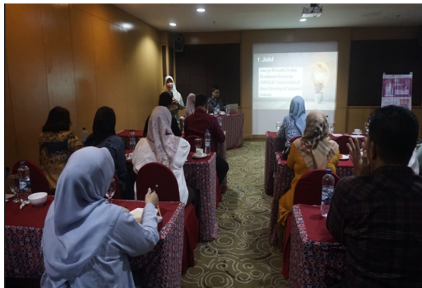
Gambar 2. Pemaparan Materi Policy Brief

Kegiatan pengabdian masyarakat ini dihadiri oleh berbagai elemen sebanyak 34 orang peserta yang meliputi perwakilan BKKBN, tenaga kesehatan, akademisi, dan kader. Kegiatan ini diawali dengan penyampaian materi policy brief oleh tim pengabdian masyarakat (Gambar 2). Kegiatan ini menunjukkan bahwa strategi diseminasi policy brief dapat memperkuat pemahaman lintas sektor terhadap pentingnya pengasuhan dini dalam masa 1000 Hari Pertama Kehidupan (HPK). Melalui diskusi kelompok terfokus (FGD), peserta menunjukkan peningkatan pengetahuan serta kesadaran terhadap urgensi pengasuhan berbasis keluarga. Interaksi ini juga menumbuhkan komitmen bersama untuk mendukung kebijakan pengasuhan di tingkat lokal.