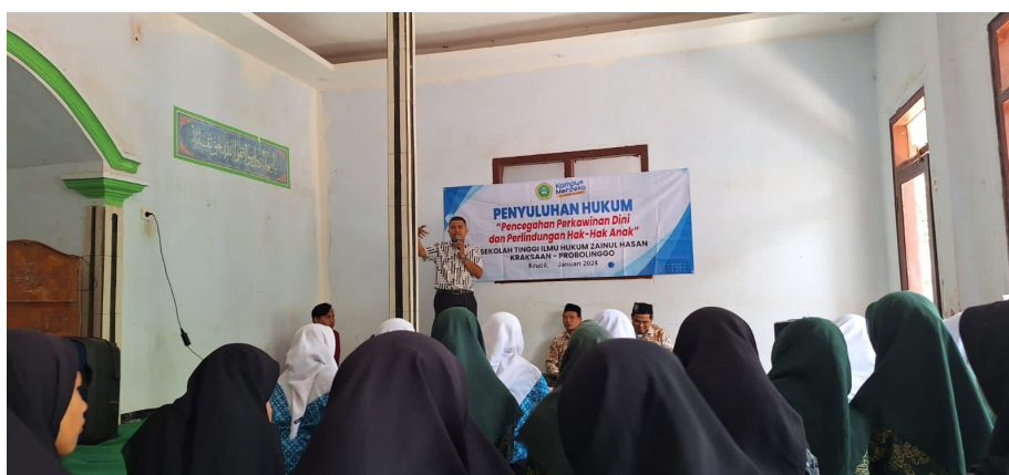
Gambar 2. Penyampaian Penyuluhan Tentang Pernikahan Dini di MA Sunan Ampel

Hakim yang menangani perkara permohonan dispensasi kawin selalu menyampaikan bahwa perkawinan dibawah umur merupakan suatu pelanggaran terhadap undang-undang, dan undang-undang ini dibuat oleh Negara semata-mata demi kebaikan rakyatnya, bukan kemudian hendak menyengsarakan rakyatnya. Oleh karenanya hakim menyarankan agar nikahnya ditunda, prioritaskan pendidikannya, kalau sudah tuntas pendidikan sampai tingkat SMA barulah boleh menikah. Hal lain yang disampaikan oleh hakim adalah dampak dari pernikahan dini terhadap kesehatan, bahwa anak yang menikah dibawah umur rentan mengalami stunting, keguguran, dan rahimnya belum siap untuk mengandung. Dari sisi psikologis, secara mental dan emosional anak masih labil, dan belum siap menghadapi permasalahan dalam rumah tangga, tidak boleh kemudian melihat pernikahan dari sudut senang-senanganya saja, karena pasti dalam membangun rumah tangga akan dihadapkan pada kondisi dan situasi permasalahan yang perlu dihadapi dengan emosional yang matang.