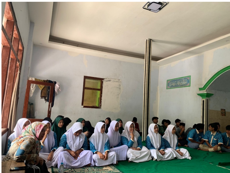
Gambar 3. Peserta Penyuluhan di MA Sunan Ampel

Banyaknya pengajuan permohonan dispensasi kawin yang ditolak, mayoritas usia 17 tahun kebawah pasti oleh hakim ditolak permohonannya walaupun terdapat alasan mendesak dan disertai bukti-bukti yang cukup. Namun hal ini tidak menyurutkan tekad calon pengantin untuk menunda pernikahannya, mereka tetap melangsungkan pernikahannya dikarenakan berbagai alasan, mulai dari malu karena sering berboncengan, sering berduaan, undangan sudah tersebar, sapinya sudah disembelih untuk acara pernikahannya, ini sudah menjadi rahasia umum fenomena yang terjadi di sosial masyarakat kita.