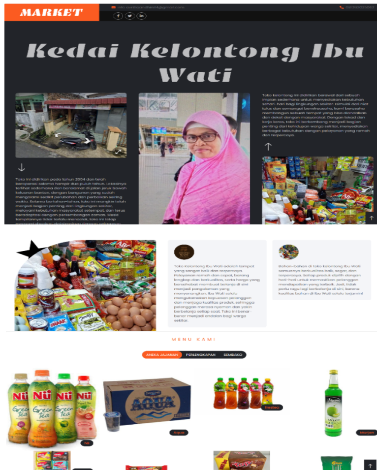
Gambar 3. Website Toko Klontong Ibu Wati